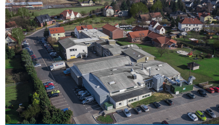
Hauptverwaltung in Grasleben