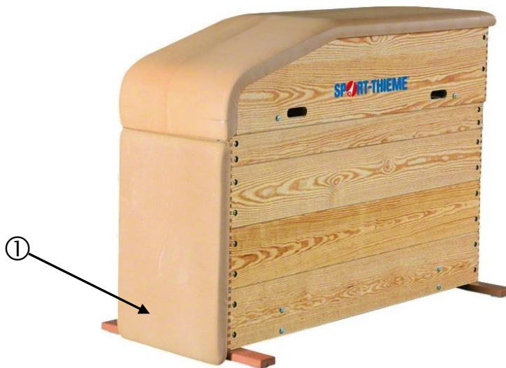
Abb.1 Sport-Thieme Stirnbrettpolster

Vielen Dank, dass Sie sich für ein Sport-Thieme -Produkt entschieden haben. Damit Sie viel Freude an diesem Produkt haben, erhalten Sie im Folgenden wichtige Hinweise für Ihre Sicherheit sowie den Gebrauch und die Wartung des Gerätes. Lesen Sie bitte diese Anleitung vollständig durch, bevor Sie mit der Montage bzw. Nutzung beginnen: