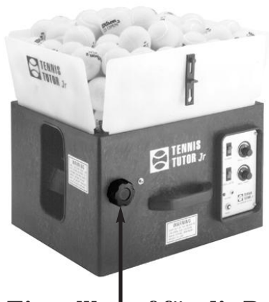
Einstellknopf für die Ballflugbahn (Höhe)

Lösen Sie den Knopf für die Einstellung der Ballflugbahn, indem Sie ihn einige Male nach links drehen. Halten Sie die Maschine mit der einen Hand, während Sie mit der anderen Hand den Knopf justieren: Für höhere Bälle bewegen Sie den Knopf nach oben. Für flachere Bälle bewegen Sie den Knopf nach unten. Haben Sie die gewünschte Ballflughöhe eingestellt, drehen Sie den Knopf nach rechts, bis er wieder fest am Gehäuse sitzt.