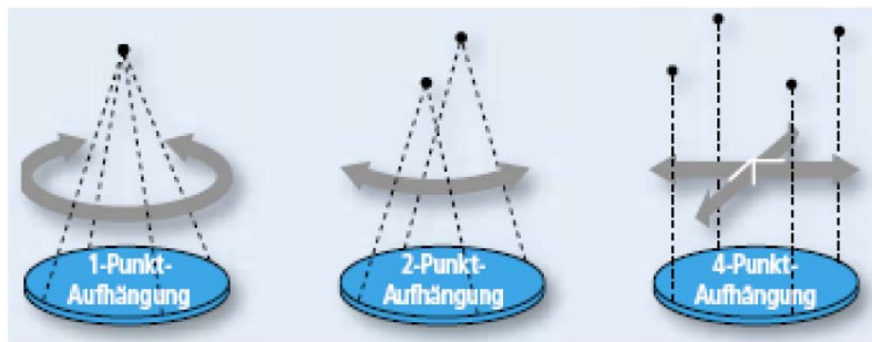
Billede 2: Ophængsvarianter og tilhørende gyngeretninger

Bevægelsesretningen ved 4-punkt, 2-punkt, og 1-punkt systemet. Ved 1-punkts ophængning kan gyngen ved anvendelse af fjeder* yderligere svinge vertikalt.