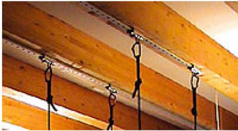
Billede 3: Skinnesæt art.nr. 201 1905