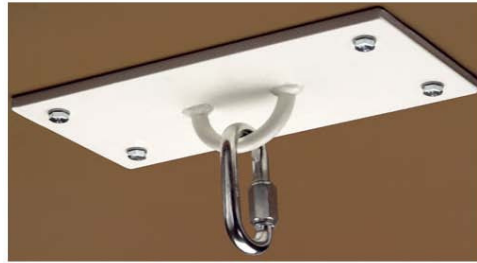
Billede 4: Loftsplade art.nr. 1773805