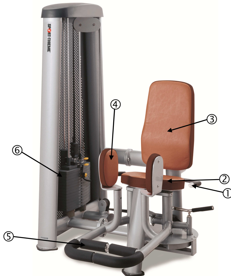
Abb.1 Sport-Thieme Abduktor / Adduktor Maschine „JS“

Vielen Dank, dass Sie sich für ein Sport-Thieme -Produkt entschieden haben. Damit Sie viel Freude an diesem Produkt haben, erhalten Sie im Folgenden wichtige Hinweise für Ihre Sicherheit sowie den Gebrauch und die Wartung des Gerätes. Lesen Sie bitte diese Anleitung vollständig durch, bevor Sie mit der Montage bzw. Nutzung beginnen: