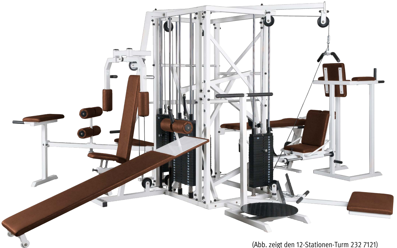
(Abb. zeigt den 12-Stationen-Turm 232 7121)

Damit Sie viel Freude an diesem Gerät haben und die Sicherheit gewährleistet ist, sollten Sie diese Anleitung zunächst vollständig durchlesen, bevor Sie mit der Nutzung beginnen. Für Fragen und Wünsche stehen wir Ihnen gerne zur Verfügung.