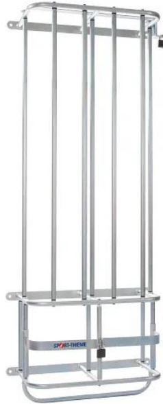
Abb. 1: Sport-Thieme Ball-Wandsafe

Bewahren Sie die Anleitung gut auf. Für Fragen und Wünsche stehen wir Ihnen gerne zur Verfügung.