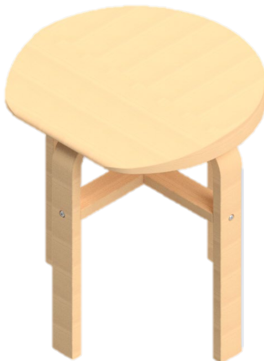
(Abb. 1: Sport-Thieme Gymnastikhocker „Ricci“)

Bewahren Sie die Anleitung gut auf. Für Fragen und Wünsche stehen wir Ihnen gerne zur Verfügung.