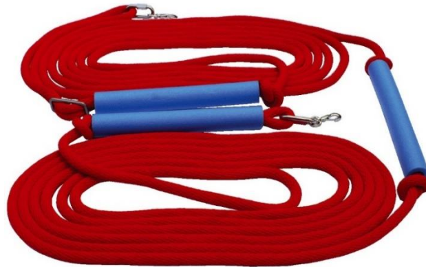
Abb. 1: Sport-Thieme® Kletterleine

Bewahren Sie die Anleitung gut auf. Für Fragen und Wünsche stehen wir Ihnen gerne zur Verfügung.