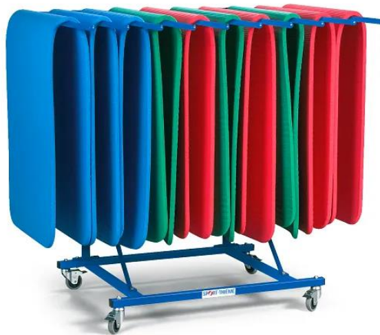
Abb. 1: Mattentransportwagen

Bewahren Sie die Anleitung gut auf. Für Fragen und Wünsche stehen wir Ihnen gerne zur Verfügung.