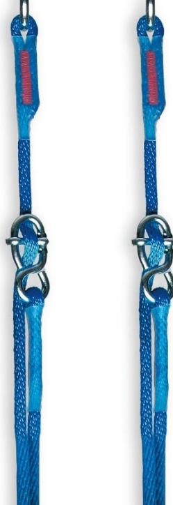
Abb. 3: Einstellen der Stellacht