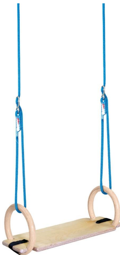
Abb. 1: Sport-Thieme Schaukelringe-Set mit Schaukelbrett

Bewahren Sie die Anleitung gut auf. Für Fragen und Wünsche stehen wir Ihnen gerne zur Verfügung.