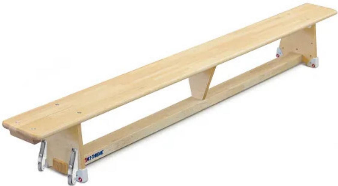
Abbildung 1: Turnbank mit Rollen

Bewahren Sie die Anleitung gut auf. Für Fragen und Wünsche stehen wir Ihnen gerne zur Verfügung.