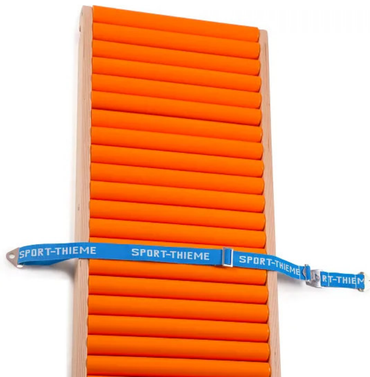
Abbildung 1: Wandbefestigungsgurt für Rollenrutschbahn

Bewahren Sie die Anleitung gut auf. Für Fragen und Wünsche stehen wir Ihnen gerne zur Verfügung.