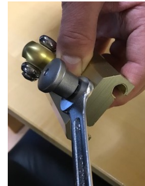
Feststellmutter mit 14er Maulschlüssel mit Kraft im Uhrzeigersinn drehen, bis sich die Feststellmutter nicht mehr bewegen lässt. Funktionsfähigkeit des Rastbolzens durch mehrmaliges Ziehen und Loslassen sicherstellen!