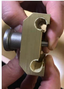
Rastbolzenstift an der Unterseite des Schlittens nach oben drücken, bis die Feststellmutter sichtbar wird.