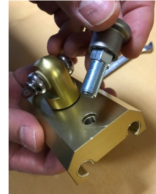
Defekten Rastbolzen gegen den Uhrzeigersinn aus dem Gewinde drehen