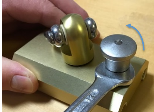
14er Maulschlüssel an Feststellmutter ansetzen und mit Kraft gegen den Uhrzeigersinn drehen, bis sich die Feststellmutter bewegt.