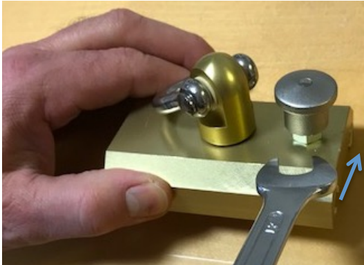
Rastbolzen nach oben ziehen bis Feststellmutter sichtbar ist.