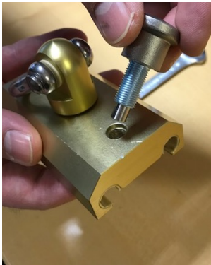
Neuen Rastbolzen im Uhrzeigersinn vollständig in das Gewinde drehen, bis die Feststellmutter auf der Schlittenoberfläche aufliegt. Achtung: Gewinde beim Ansetzen nicht verkanten!