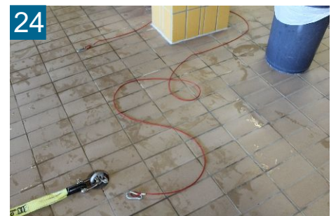
24 Sicherungsseil um Halterung legen