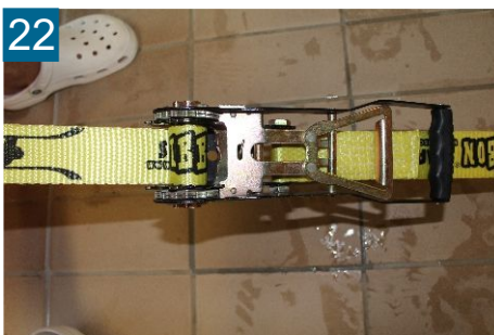
22 Gesicherte Ratsche