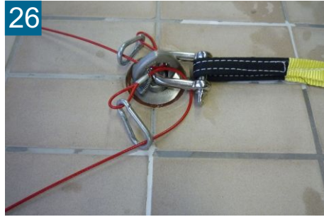
26 Sicherungsseil gegenüber an Schäkel befestigen