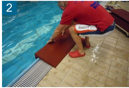
2 rechten Winkelschutz am Beckenrand ablegen