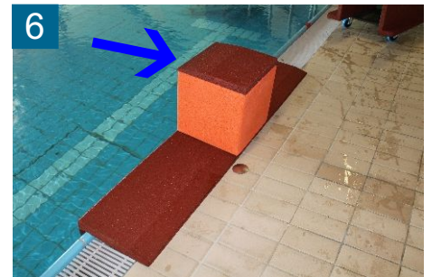
6 Randplatte passgenau auf EPDM-Würfel auflegen, Fläche Seite zum Wasser