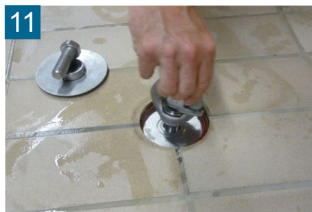
11 Inbus einstecken Halteschraube eindrehen