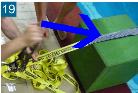
19 Auf gleichmäßige Ausrichtung des Abriebschutzes achten