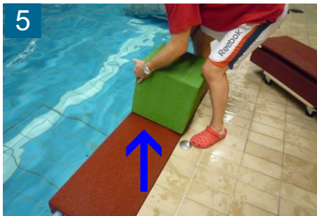
5 EPDM-Würfel passgenau und mittig auflegen