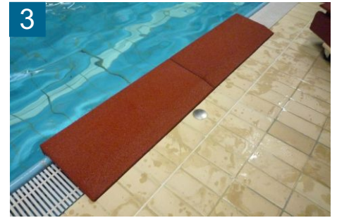
3 linken Winkelschutz am Beckenrand ablegen