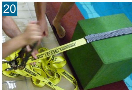
20 Slackline durch Zug vorspannen und ca. 3 mal ratschen bis Line greift