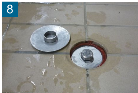
8 Abdeckung entfernen