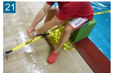
21 Slackline spannen Handkraft, ohne Hilfsmittel! Wichtig - Ratsche sichern!