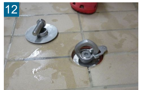
12 Halteschraube bis Anschlag - nur Handkraft - Inbus lösen -

Die vorgenannten Aufbausritte sind auch auf der gegenüberliegenden Seite durchzuführen