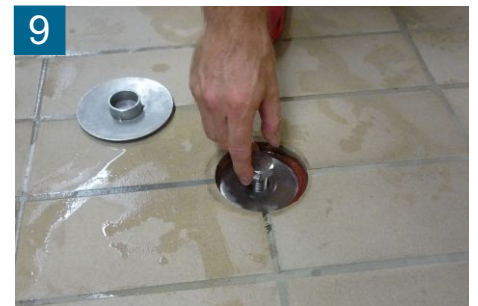
9 Schutzschraube herausdrehen