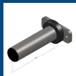
Scheibenaufnahme ø 30 und 50 mm