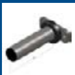
Scheibenaufnahme ø 30 und 50 mm