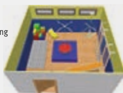
3-D-Zeichnungen in versch. Perspektiven