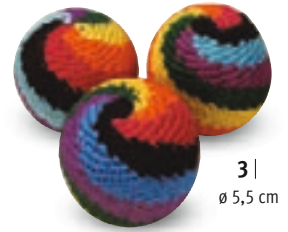
3 | ø 5,5 cm