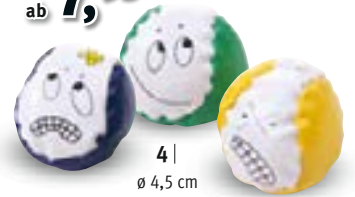
4 | ø 4,5 cm