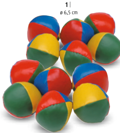
1 | ø 6,5 cm

Achtung! Nicht für Kinder unter 3 Jahren geeignet. Verschluckbare Kleinteile. Erststickungsgefahr.