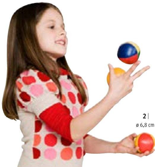
2 | ø 6,8 cm