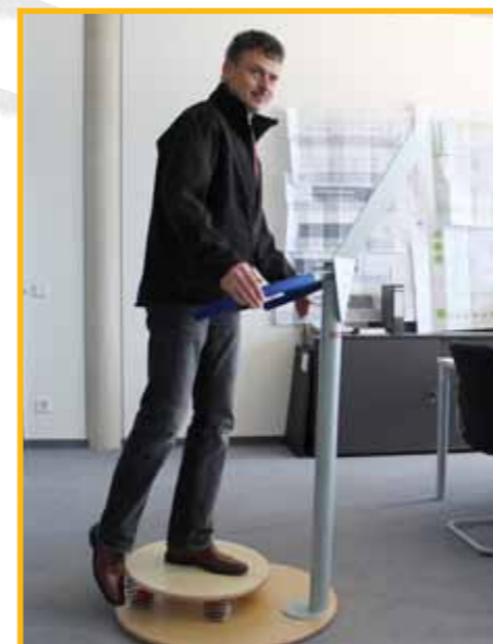
F. KIRCHHOFF SYSTEMBAU GmbH, Münsingen

In Firmen bieten die einzelnen Stationen im Rahmen des betrieblichen Gesundheitsmanagement das notwendige Bewegungsangebot als Ausgleich zum Sitzen. Verspannungen werden somit vorgebeugt. Schaffen auch Sie Bewegungsangebote innerhalb Ihrer Büroräumlichkeiten. Der Parcours lässt sich dabei optimal einbinden. Verwandeln Sie Sitzecken, Flure und Besprechungsräume zu unauffälligen und doch präsenten Bewegungslandschaften. Bereits 5 Minuten aktive Bewegung zwischendurch steigert erheblich die Leistungsfähigkeit Ihrer Mitarbeiter, mit nachhaltiger Wirkung auf deren Gesundheit.