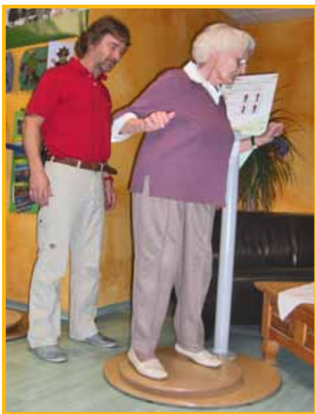
Seniorenheim Haus Grafental in Trochtelfingen

... selbst im hohen Alter! Dies ist keine Wunschvorstellung, denn das Seniorenheim Grafental in Trochtelfingen macht es vor! Pflegepersonal wie Heimbewohner trainieren seit längerem auf dem pedalo®-5S-Koordinationsparcours und verbessern dabei ihre Haltungs- und Bewegungskoordination beachtlich. Die Verbesserungswerte der Gleichgewichtsfähigkeit wurden anhand der pedalo®-Balancesoftware dokumentiert.