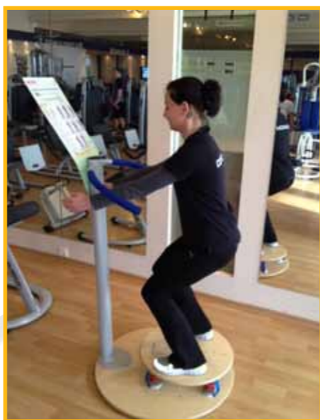
A.J.'s Health & Fitness, München

Trainieren im Vorbeigehen: „Minimaler Aufwand - maximaler Erfolg?!“ Entwicklung der Gleichgewichtsfähigkeit durch Training mit dem pedalo®-5S Koordinationsparcours im A.J.'s Fitness. Unter diesem Titel schrieb Julia Witzany an der Deutschen Hochschule für Prävention und Gesundheitsmanagement in München ihre Bachelor-Thesis.